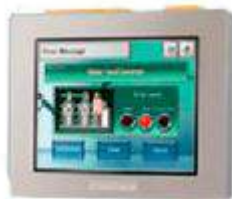
Ecran tactile couleur