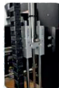
Unité de guidage en H